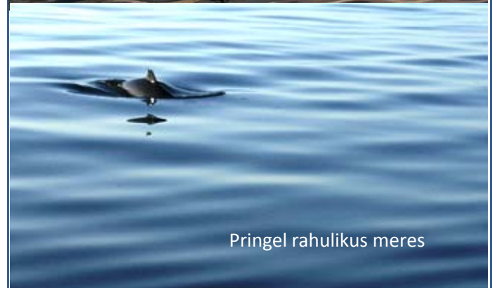
Pringel rahulikus meres